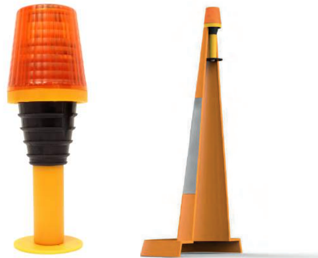
ECLAIRAGE RENTABLE ET DURABLE