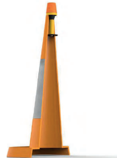
ECLAIRAGE RENTABLE ET DURABLE