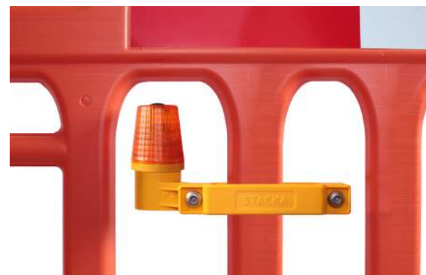
DURABILITÉ ET RENTABILITÉ